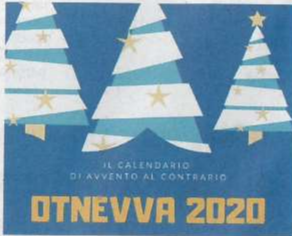
Il simbolo dell'iniziativa

L'idea è nata in Belgio come iniziativa concreta di aiuto ai senzatetto e si propone in evidente alternativa ai calendari commerciali che dispensano ogni giorno un dolcetto. In questo caso, invece, si tiene sotto mano e sott'occhio a casa un calendario ...alla rovescia e giorno per giorno ci si impegna a mettere dentro ad una scatola qualcosa di utile da donare a chi si trova nel bisogno. La proposta prevede per la prima settimana